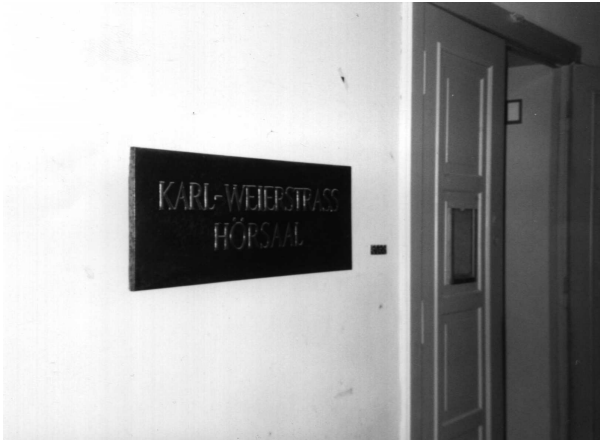
圖五. Karl-Weierstrass 講堂