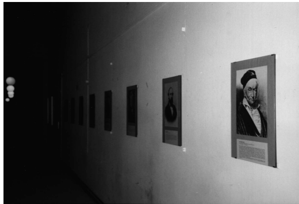
圖七. 走道上的數學家圖像

另一次的數學之旅則是由一位柏林自由大學的數學家帶隊。參加的人較多，包括了一位十年前逝世的密西根大學數學教授 A. Shields 的遺孀。大家仍是乘地下鐵，先到柏林市南面的一處教會墓園 Cemetery of St. Matthews parish。其內環境優雅，維護整潔，林蔭之間一座座墓地整齊地排列著。我們先找到 Kronecker 的墓（見圖八）。其後的一大塊石碑上刻有他和他太太的出生及死亡的時日（Kronecker 是在 1891 年他太太過世四個月後去世的）。另外我們也在旁邊不遠處