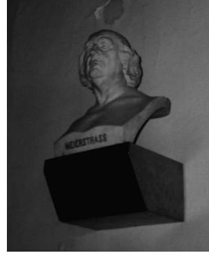
圖六. Weierstrass 頭像