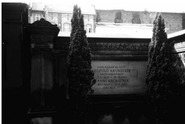
圖八. Kronecker 的墓碑

數學的發展源於一代一代數學家不斷的努力,持續創造一個又一個數學的高峰。柏林數學在歷經兩百五十年高度的發展後,到了第二次世界大戰前,由於納粹政治勢力的介入,佔多數的猶太裔數學家受到迫害而離職,使得這個優良傳統遽而中斷。二次世界大戰後,隨著時勢的轉移,韓伯特大學的數學早已喪失其領袖群倫的地位而淪落至一般的水準了。這一次配合數學家會議的舉行,德國數學會 (DMV) 也辦了一項名為“Terror and Exile”(恐怖與流放)的展覽,以圖片及文字