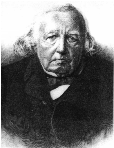
圖四. Karl Weierstrass

以及他對數學哲學的看法：他堅持用數學公式及演算法來達到他的數學結論，而不接納他的同事 Weierstrass 及其後的 Cantor 用二分法邏輯所作的推論。